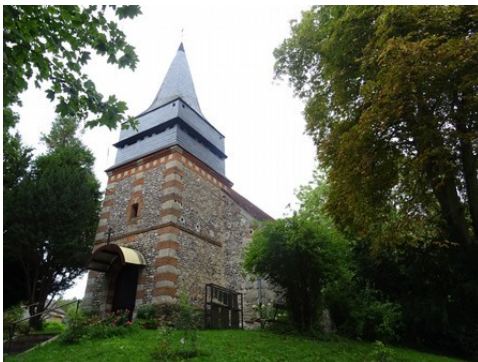
L'ancienne église de Provemont

Les avis seront cohérents avec ceux émis ces dernières années, à savoir : pas de maisons à volume compliqué (type V, W, Y, ou Z), pentes à 45° pour les volumes principaux, ardoise ou tuile plate de teinte brun vieilli, à 20u/m², avec un débord de toiture de 20cm, enduit de teinte beige clair avec modénatures (au choix : chaînages, encadrement de fenêtres, soubassement, colombage...). *Voir les autres fiches.