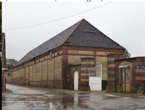
Le bâti rural avoisinant