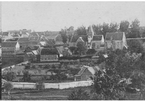
Vue depuis la vallée