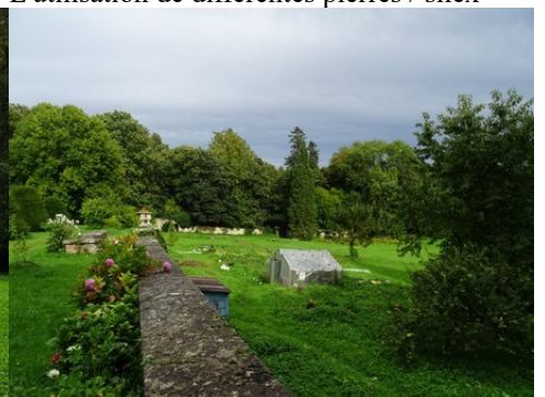
Le parc du château de Provemont