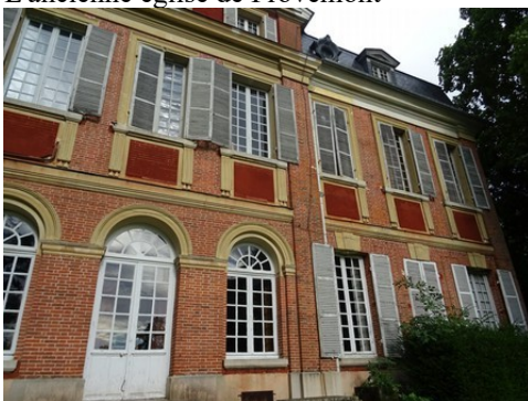
Le château voisin de Provemont