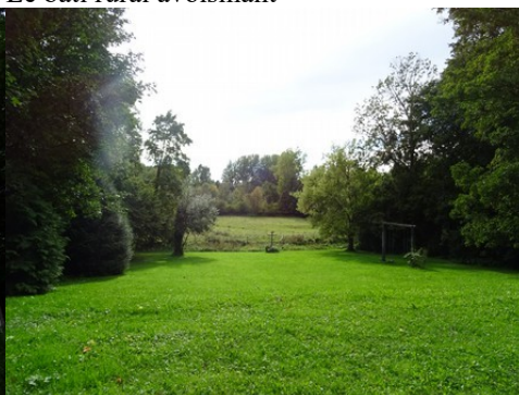
La vue vers le vallon de la Bonde