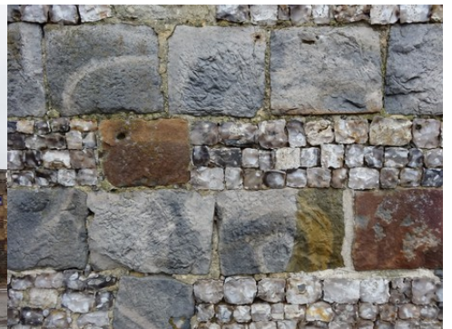
L'utilisation de différentes pierres / silex